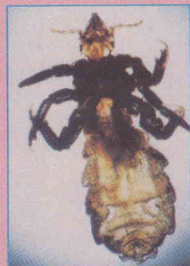
コロモジラミ 体長約3 mm