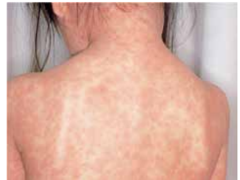
「学校における麻疹対応ガイドライン」から https://www.niid.go.jp/niid/images/idsc/disease/measles/guideline/school_201802.pdf

感染経路は「空気感染」、「飛まつ感染」、「接触感染」でヒトからヒトへうつります。発症した人が周囲に感染させる期間は、発熱の前日から発疹出現後 4～5 日くらいまでです。感染力は極めて強く、免疫を持っていない人が感染するとほぼ 100% かかりますが、一度感染して発病すると一生免疫が持続します。