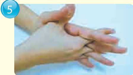
Between fingers 指缝 / 手指缝 / 손가락 사이