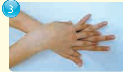
Back of hands 手背 / 手背 / 손등