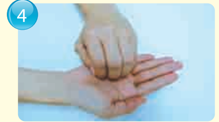
Finger tips and between fingernails 指尖、指甲缝 / 指尖、指甲缝 / 손끝 및 손톱 사이