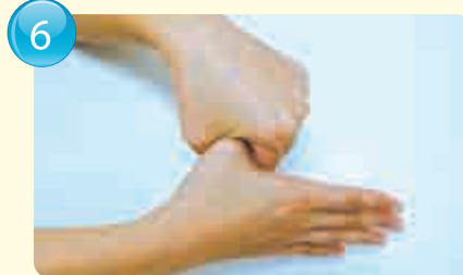
Thumbs (cover with palm and twist) 拇指 (用手掌包住搓洗) / 拇指 (以手掌包覆扭转搓洗) / 엄지손가락(손바닥으로 감싸 돌리면서 씻기)