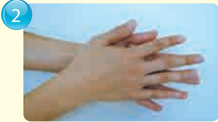
Palm of hands 手心 / 手掌 / 손바닥

1 Wash your hands with running water and apply soap. 用流水洗手，并抹上肥皂。/ 以流水冲手，抹肥皂。/ 흐르는 물로 손을 적신 후 비누를 칠한다.