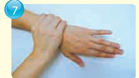
Wrists 手腕 / 手腕 / 손목

8 Rinse with running water and wipe off moisture with paper towel or clean towel. (Disinfecting is less effective when moisture remains) 用流水冲，再用纸巾或清洁毛巾将水擦干。(如果没有擦干，消毒效果会降低) / 以流水冲洗，用纸巾或乾淨的毛巾擦乾。(若水分残留，消毒效果会降低) / 흐르는 물로 헹구고 핸드 타월이나 깨끗한 수건으로 물기를 닦는다.(수분이 남아 있으면 소독 효과가 감소)