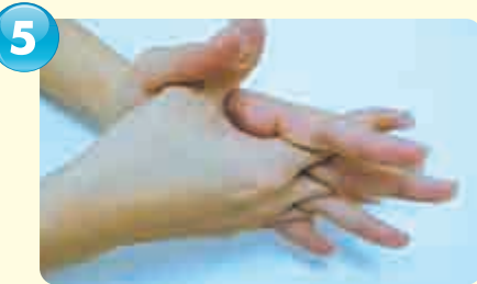
ゆび あいだ 指の間