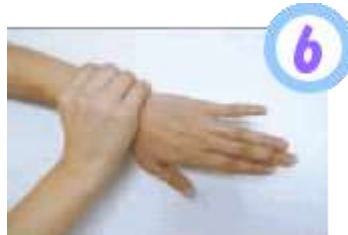
手首も忘れずに洗う