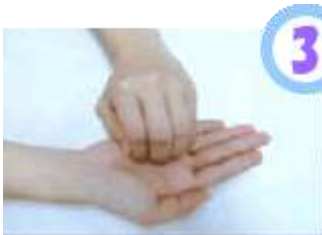
指先・ツメの間を念入りにこする