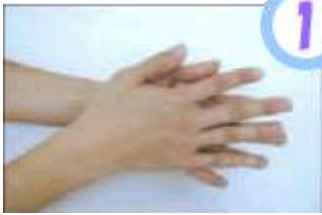
石鹸をつけ手のひらをよくこする