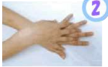
手の甲を伸ばすようにこする