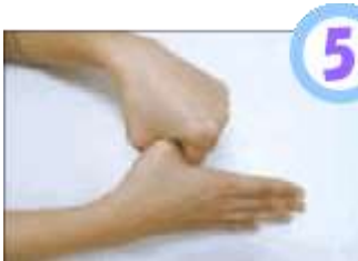
親指と手のひらをねじり洗う