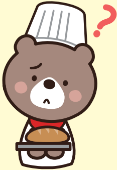
くまさん (くまさん ベーカリー店主)

ねえねえ、とらさん。HACCPが義務化されるって聞いたけど、そもそも「HACCP」って何のこと？