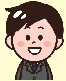
とらさん (保健所の食品 衛生監視員)

1960年代に、宇宙食の安全管理のために開発された衛生管理の手法ですよ！ 詳細を説明しますね。