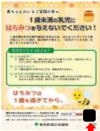
A 5判リーフレット（平成30年版、令和元年版）