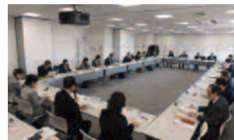
【食品安全情報評価委員会】