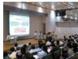
【食の安全都民フォーラム】 (パネルディスカッション)