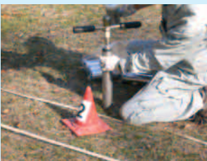
【ダイオキシン類土壌環境調査】 (試料採取状況)

環境中や農畜産物、魚介類などに含まれる微量化学物質の調査を行い、環境からの食品の汚染実態を把握しています。