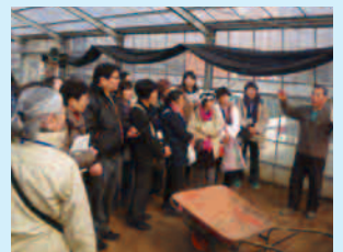
【東京のがんばる農業応援バスツアー】 (東京都消費者月間事業)

食品の安全に対する意識の向上を図るため、都民が自主的に学習する際の各種教材や学習する場を提供しています。