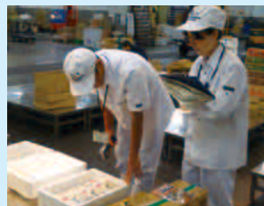
【卸売市場における監視指導】

卸売市場など食品の流通の拠点となる施設や、地域の営業施設の監視指導を行い、都内に流通する食品の安全確保に取り組んでいます。