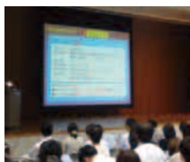
【食品表示の事例検討】 (適正表示推進者育成講習会)