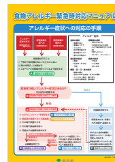
【食物アレルギー緊急時対応マニュアル】