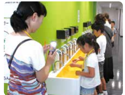
食の安全子ども調査隊