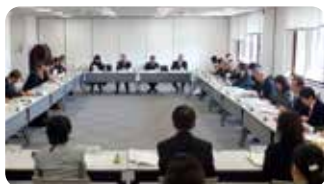
食品安全情報評価委員会