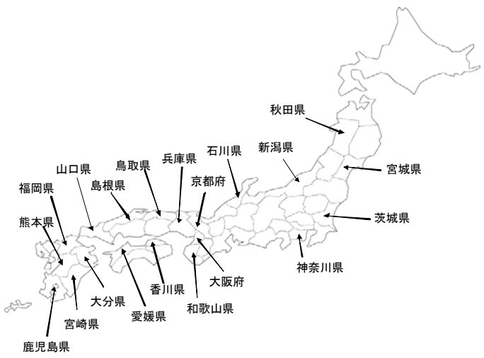
第1図 Anisakis simplex sensu stricto の検出分布