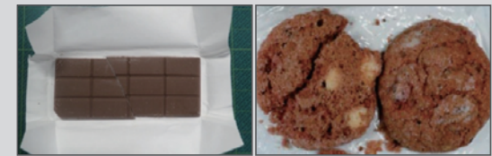
大麻入りチョコレート 大麻入りクッキー

海外では、大麻の成分が入ったお菓子などが販売されています。まちがって買わないように注意しましょう。