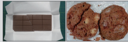
大麻入りチョコレート

海外では、大麻の成分が入ったお菓子などが販売されています。まちがって買わないように注意しましょう。