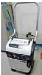
カセットボンベ 発電機

* 「緊急時飲料提供ベンダー」とは、災害などの緊急時に、飲料を設置施設が簡単に無料で取り出すことができる自動販売機（通常は普通の自動販売機として販売）