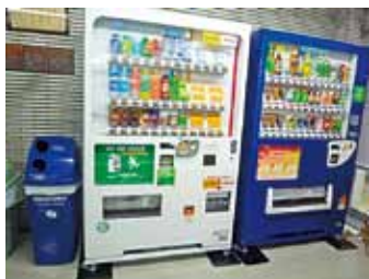
緊急時飲料提供ベンダー