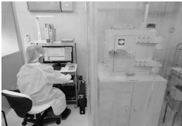
ゲルマニウム半導体核種分析装置（右）による食品検査の様子