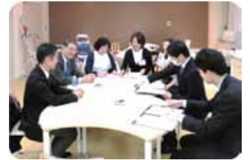
↑ 相談会後の反省会の様子