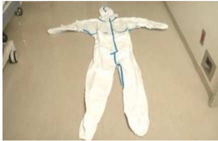
ワンピース型防護服