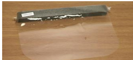
フェイスシールド