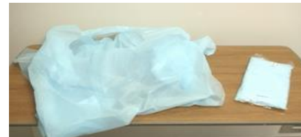
プラスチックガウン