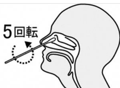
鼻腔ぬぐい液採取