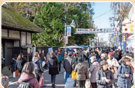
(28年12月15日、代官屋敷前で)

毎年12月15日・16日と翌年1月15日・16日に開催。東急世田谷線「世田谷」駅と「上町」駅の間を会場に、日用品や骨董品、食べ物など約700店もの露店が並ぶ。中でもこの期間しか販売されない名物の代官餅を求め、毎年多くの人が行列を作る。