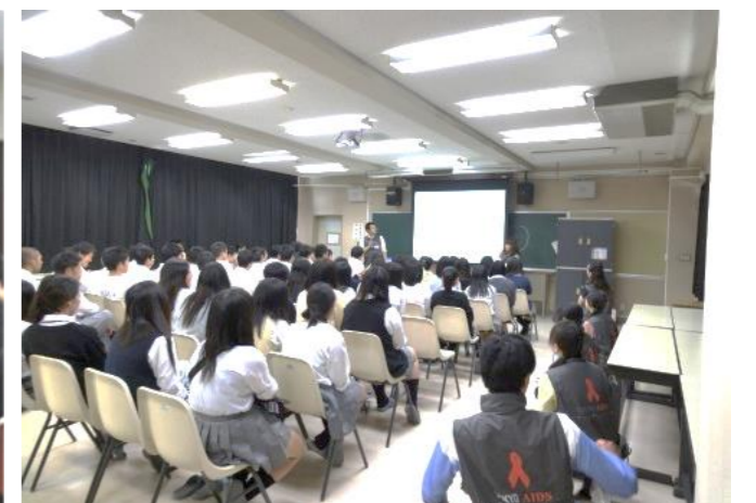
画像：エイズピアエデュケーションを実施している様子