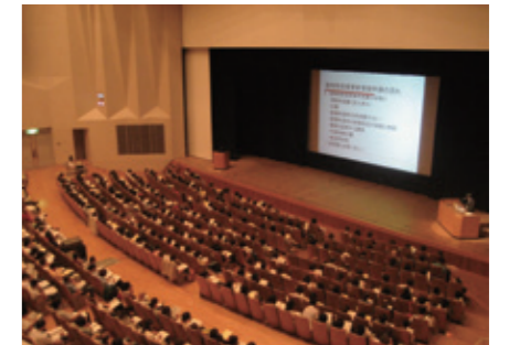
動物取扱責任者研修の様子