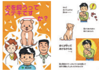
動物愛護冊子・アニメーション 「犬を飼うってステキですか？」