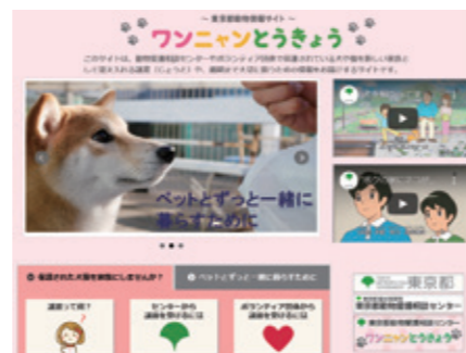
東京都動物情報サイト 「ワンニャンとうきょう」