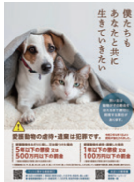
「遺棄・虐待防止ポスター」