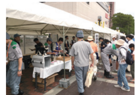
総合防災訓練における普及啓発