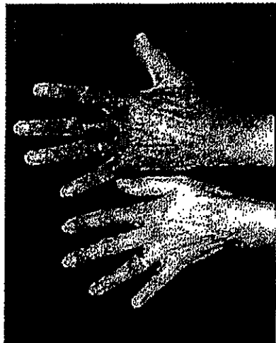
輸血後鉄過剰症の診療ガイド から引用