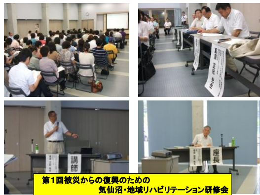
第1回被災からの復興のための 気仙沼・地域リハビリテーション研修会