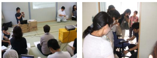
第2回被災からの復興のための 気仙沼・地域リハビリテーション研修会