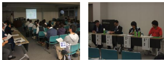
被災からの復興のための 気仙沼・地域ケア・リハビリテーションフォーラム