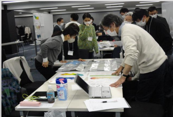
都災害想定に基づき被災状況を分析