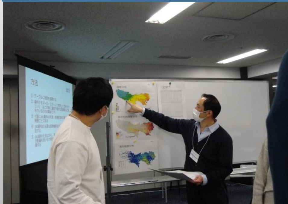
ファシリテーターの災害医療コーディネーターと連携