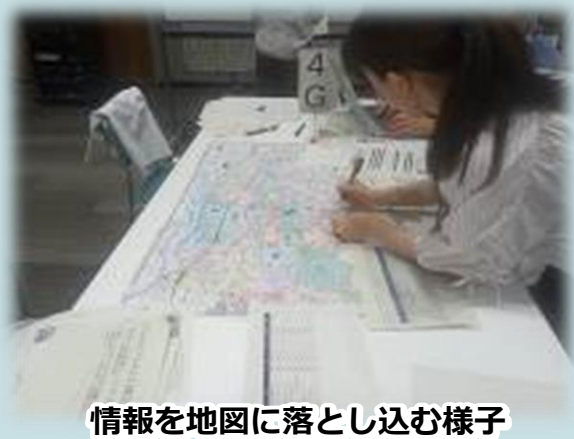
情報を地図に落とし込む様子