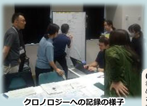
クロノロジーへの記録の様子