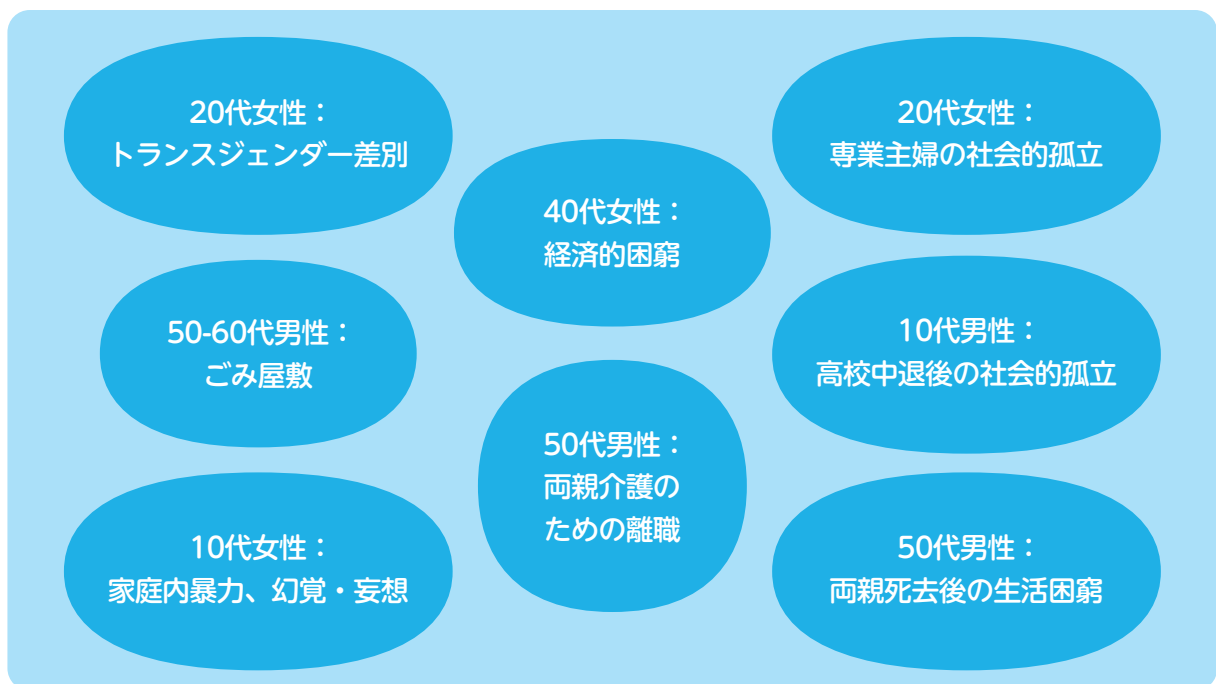
図1 ひきこもり事例