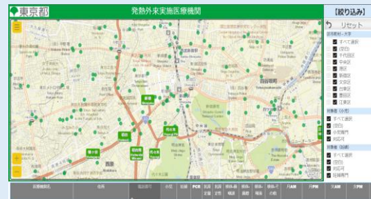
診療・検査医療機関マップ