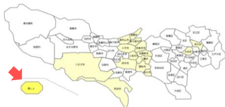
都内の保健所別定点当たり患者報告数(第11週)