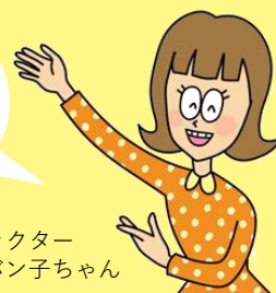
日本骨髄バンク公式キャラクター 骨髄バン子ちゃん

学生・会社員・主婦の方など、さまざまな方に活躍していただいています！ たくさんの方にドナー登録をしていただくことが、今も移植を待っている患者さんの命を救うことに繋がります。 みなさまのご応募をお待ちしています！