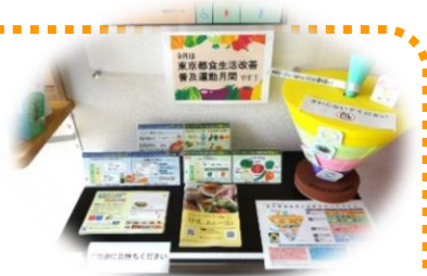
保健所の掲示スペース