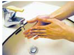
⑦せっけんを 十分な水で流す