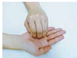
③指先・爪の間を 念入りにこする