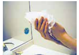
⑧ペーパータオルでよくふく。 ①から⑦までをもう1回 繰り返す。必要に応じて アルコール等で消毒する。