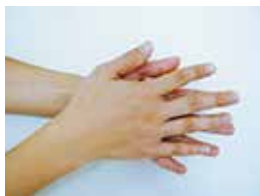
①せっけんをつけ 手のひらをよくこする