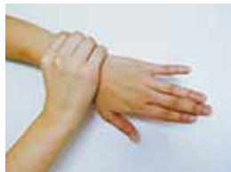
⑥手首も忘れずに洗う