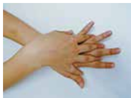
②手の甲を伸ばすように こする