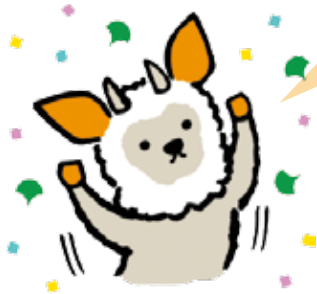
東京都がん検診啓発キャラクター「モンカモくん」

都民の死因第1位はがんです。全死亡者の3人に1人、年間約3万3千人ががんで亡くなっています。