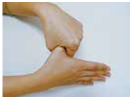
⑤親指と手のひらを ねじり洗いする