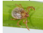
<キチマダニ 1) >