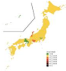
(2024年2月14日現在)