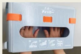
手洗いチェッカー