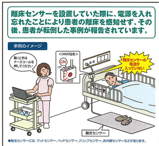
No.197 離床センサーの電源入れ忘れ