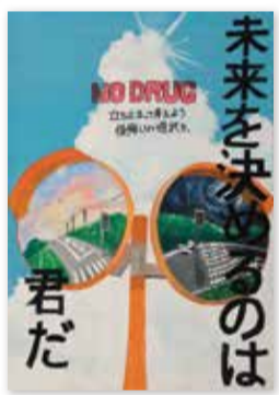
江戸川区立 鹿骨中学校 3年