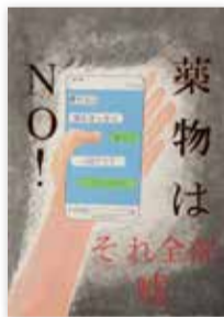
荒川区立 第七中学校 2年