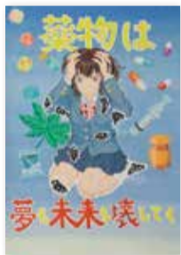
港区立 三田中学校 2年