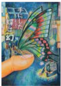
優良賞 町田市立 鶴川第二中学校 3年