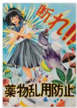
府中市立 府中第五中学校 2年