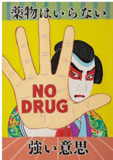
最優秀賞 小金井市立東中学校 3年