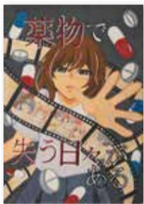
杉並区立 神明中学校 1年