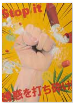
優秀賞 墨田区立 豊川中学校 2年