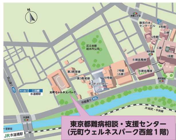
東京都難病相談・支援センター (元町ウェルネスパーク西館1階)