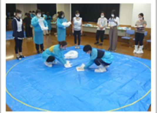
おう吐物処理訓練 （おう吐物を拭き取る様子）