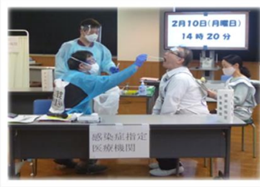
新興感染症等発生時対応 図上訓練（検体採取の様子）