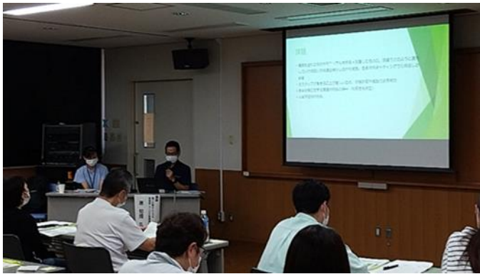
感染症対策講演会 （講師による講話の様子）