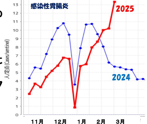
定点医療機関当たり患者報告数(東京都)

《編集・発行》 東京都島しょ保健所 三宅出張所 電話 04994-2-0181 FAX04994-2-1009