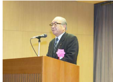
田中 雅夫 あきる野市長