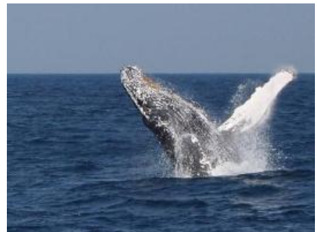
冬にはザトウクジラが訪れます