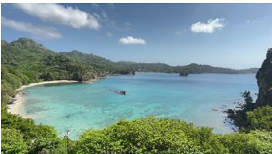
沈船を間近にみることが出来る境浦海岸