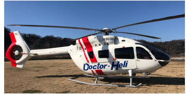
使用機体：エアバス式H145（定員：7人）等

救急医療に必要な機器及び医薬品を装備したヘリコプターであって、救急医療の専門医及び看護師等が同乗し、救急現場等に向かい、現場等から医療機関に搬送できる専用のヘリコプター