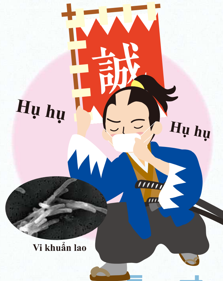
Vi khuẩn lao

Cục Chăm sóc Sức khỏe Phúc lợi thủ đô Tokyo