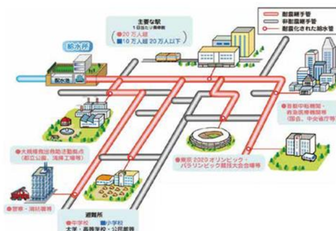
<重要施設への供給ルート耐震継手化(イメージ図)>

そこで、首都中枢機関、救急医療機関、避難所、主要な駅、大規模救出救助活動拠点、東京2020オリンピック・パラリンピック競技大会会場等の重要施設への供給ルートについて、より一層優先的に配水管の耐震継手化を進めるとともに、被害が大きいと想定される地域の配水管の耐震継手化を進めている。