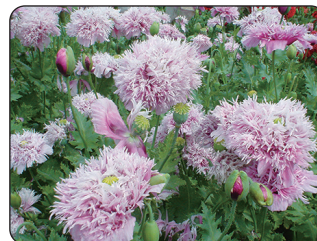
植えてはいけないけし

※リーフレット作成に当たり、厚生労働省関東信越厚生局麻薬取締部及び公益財団法人麻薬・覚せい剤乱用防止センターの御協力を頂きました。